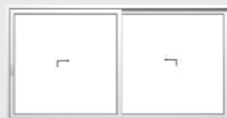
Schema D 2 Hebe-Schiebeflügel