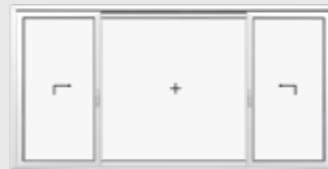
Schema K 2 Hebe-Schiebeflügel, 1 Festverglasung