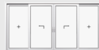
Schema C 2 Hebe-Schiebeflügel, 2 Festverglasungen