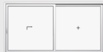
Schema A, DIN links 1 Hebe-Schiebeflügel, 1 Festverglasung